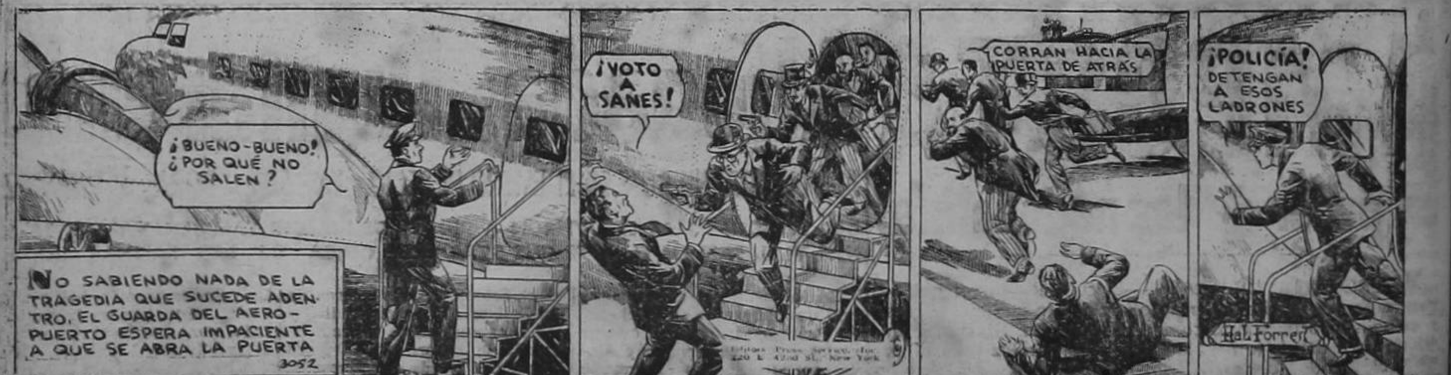
NO SABIENDO NADA DE LA TRAGEDIA QUE SUCEDE ADENTRO, EL GUARDA DEL AEROPUERTO ESPERA IMPACIENTE A QUE SE ABRA LA PUERTA